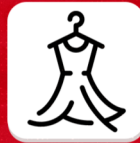
LOJA DE VESTUÁRIO

Relojoaria, Conveniência, Recarga de Cartuchos e Tonners, Móveis, Equipamentos Esportivos, Eletrodomésticos, Material Elétrico, Departamentos, Cosméticos, Brinquedos, Bijuteria, Papelaria, Produtos Agrícolas, Informática, Agropecuária em geral, Mercados e muito mais.