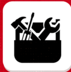
LOJA DE FERRAMENTAS