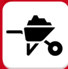
MATERIAIS DE CONSTRUÇÃO